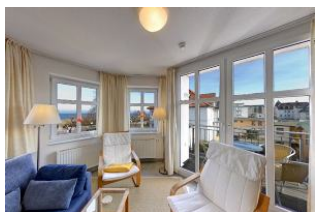
Wohnbereich mit Seeblick

Direkt an der Strandpromenade mit SEEBLICK und FAHRSTUHL im Haus! Schönes geräumiges 2-Zimmer-Apartment mit hochwertiger Ausstattung. Separates Schlafzimmer, Wohnzimmer mit Küchenzeile und Essplatz, Duschbad, Balkon nach Osten - zum Frühstück in der Sonne. Die Wohnung verfügt über einen Tiefgaragen-Pkw-Stellplatz. In der Garage können auch Fahrräder und ähnliches untergestellt werden. In unserer "Villa Germania" nebenan gibt es eine Sauna. Von der "Villa Aquamarina" aus können Sie das Ortszentrum und die Ahlbecker Seebrücke in ca. 3 Minuten zu Fuß erreichen. Zum Strand sind es 50 m.