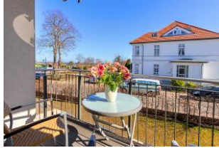
Balkon mit Ausblick