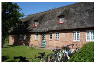
Der Hauseingang zur Wohnung 1, 2, 4 und 5 befindet sich links am Haus

Das Hüs Dikstian in Alkersum bietet 5 Ferienwohnungen verschiedener Größe. Hier stellen wir Ihnen die Whg. 5 im 1.OG vor. Kommen Sie herein in diese kuschelige Wohnung, die in weißen, sandfarbenen und Blautönen schon Urlaubsfeeling beim "herein kommen" ausstrahlt. Das Wohnzimmer mit Essplatz und offener Küche, das Schlafzimmer in blau-weiß und das Badezimmer, teilw. schon neu gestaltet, strahlen so viel Frische und Gemütlichkeit aus, wie man es nicht überall findet. Treten Sie ein und lassen sich gefangen nehmen.