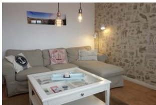
links im Raum die Große Couch zum hinein kuscheln...