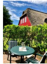
...Tisch und Stühlen.