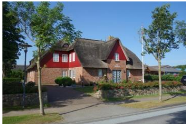
Das Hüs Dikstian in Alkersum. Der Eingang zur Wohnung 5 befindet sich links an der Seite. Der Parkplatz vor dem Haus.