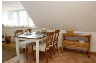
der erste Blick fällt auf den Essstisch