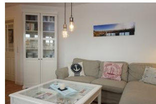
Der Vitrinenschrank beherbergt das Geschirr und die Gläser.