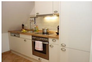
...rechts zur offenen Küchenzeile....