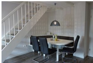
Der große Essplatz für Alle