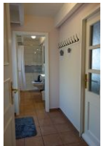
Der kleine Flur führt ins Bad. Rechts die Tür in die Garage, links die Tür auf die Terrasse