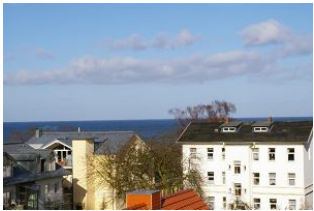
Seeblick Ostseewarte Nr. 17