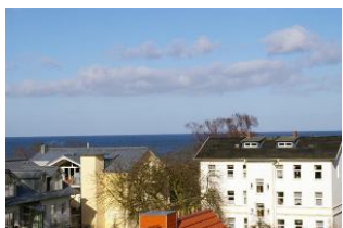
Seeblick Ostseewarte Nr. 17