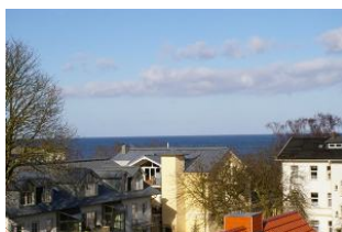
Seeblick aus der Veranda Ostseewarte Nr. 14