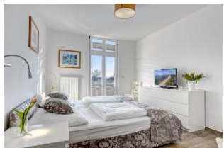
Schlafzimmer mit Zugang zum Balkon