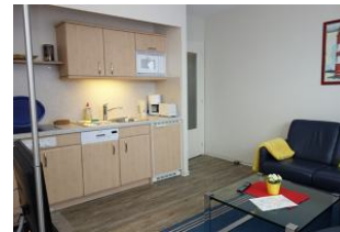
Hier noch einmal die Küchenzeile