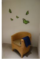
.... gemütlichem Sessel zum ausruhen.