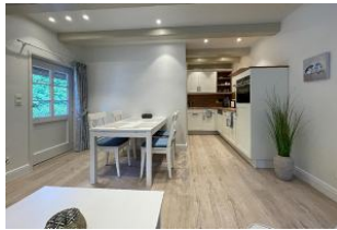
offene Küche mit Essbereich