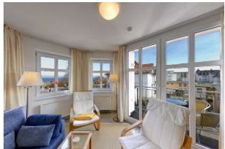
Wohnbereich mit Seeblick

Direkt an der Strandpromenade mit SEEBLICK und FAHRSTUHL im Haus! Schönes geräumiges 2-Zimmer-Apartment mit hochwertiger Ausstattung. Separates Schlafzimmer, Wohnzimmer mit Küchenzeile und Essplatz, Duschbad, Balkon nach Osten - zum Frühstück in der Sonne. Die Wohnung verfügt über einen Tiefgaragen-Pkw-Stellplatz. In der Garage können auch Fahrräder und ähnliches untergestellt werden. In unserer "Villa Germania" nebenan gibt es eine Sauna. Von der "Villa Aquamarina" aus können Sie das Ortszentrum und die Ahlbecker Seebrücke in ca. 3 Minuten zu Fuß erreichen. Zum Strand sind es 50 m.