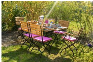
Frühstück im Garten