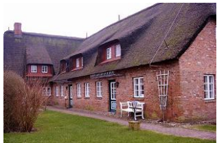
Aussenansicht des Hauses

Laerchenhus ist Teil eines ehemaligen altfriesischen denkmalgeschützten reetgedeckten Bauernhofes im historischen Kern des Inselforfes Borgsum. Dieser Anbau befindet sich in der Seitenstrasse Alles neu und modern eingerichtetes Hausteil. Der große Garten wird von alten Laubbäumen beschattet. Über zwei Ebenen verteilt, bietet Ihnen unser Ferienhaus 'Laerchen's Hus' ein stilvolles Wohnen in behaglicher Atmosphäre ankommen und wohlfühlen. Im Erdgeschoss bietet Ihnen diese Wohnung viel Raum in dem grossen Wohnzimmer und der abgeteilt Küche mit dem grossen Esstisch. Auch wenn das Wetter mal nicht mitspielt können sie sich hier erholen, Im 1 OG befinden sich 3 Schlafzimmer und das Badezimmer mit Dusche und WC. Für gemeinsame Abende sind Gemeinschaftsspiele vorhanden, aber auch Bücher und Wlan Nutzung ist möglich. Hunde sind herzlich willkommen.