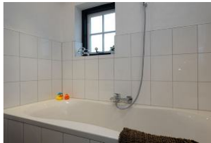
...die Badewanne für das "Relaxprogramm"