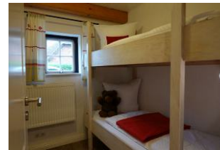
..klein aber fein, das Kinderzimmer mit Etagenbett. Nicht im Bild, ein kleines TV Gerät