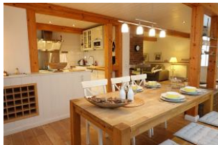
Der Tisch ist schon gedeckt, wer kocht ???