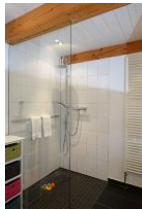
...hier noch einmal aus der Nähe