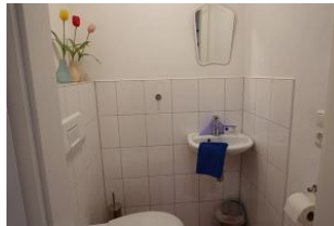
Das Gäste - WC im Erdgeschoß