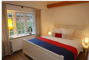
Das Elternschlafzimmer im Erdgeschoß..