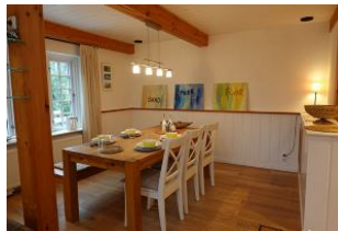
Ein Esstisch für Alle.