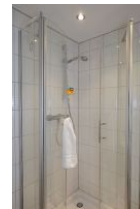
Das Badezimmer im Obergeschoß mit Dusche....