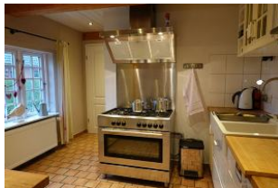
...ein Kinderspiel bei einem solchen Gasherd....