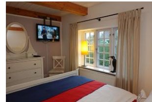
...mit zus. TV Gerät