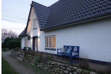
Die Aussenansicht des Hauses Friesengeist in Wrixum, Ohl Dörp 25

Die Unterkunft verteilt sich über EG und 1.OG.