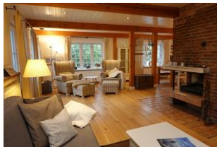
...gemütliche Couch, 2 Sessel und der Kamin - was braucht man mehr ?