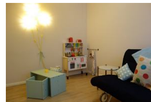
...und für unsere kleinen Gäste ein Tisch mit Stühlen und eine Spielküche