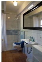
Das Duschbad im Erdgeschoß