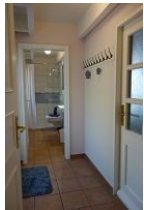
Der kleine Flur führt ins Bad. Rechts die Tür in die Garage, links die Tür auf die Terrasse