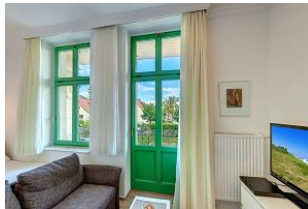
Küchenzeile und Eßplatz