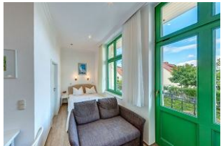
Kombinierter Wohn- / Schlafraum

STRANDNAH! Nur ca. 100 m zur Strandpromenade mit BALKON! Gemütliches 1-Zimmer-Apartment mit guter Ausstattung. Wohn-/Schlafraum mit Doppelbett und Sitz-/Sofaecke, Küchenzeile mit Essplatz, kleines Duschbad mit großer walk-in-Dusche, Balkon. Die Wohnung verfügt über einen Pkw-Stellplatz. Abstellraum für Fahrräder und ähnliches ist vorhanden. Eine Sauna in der "Villa Germania" kann kostenpflichtig genutzt werden. Vom Haus aus können Sie das Ortszentrum und die bekannte Ahlbecker Seebrücke in ca. 3 bzw. 5 Minuten zu Fuß erreichen.