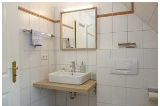
Der Waschtisch im Bad