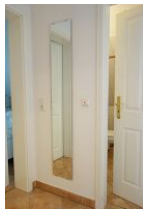
Im Flur ein großer Spiegel