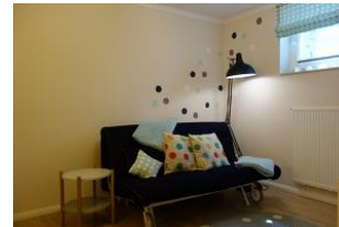
Das Spielzimmer mit Schlafcouch für Besuch...