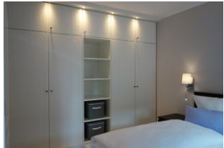
Genügend Schrankraum !