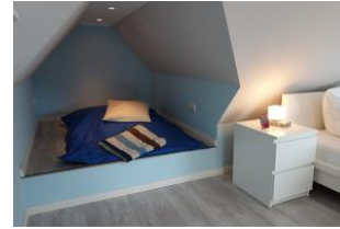
Der Clou: die Kinderhöhle