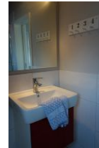
Auch im Dachgeschoß befindet sich ein kleines Bad mit Waschtisch, Toilette (nicht im Bild) und...