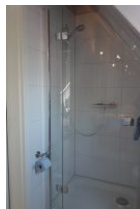
...Duschkabine mit Echtglas.