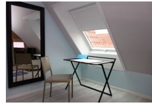
...ganz neu: ein Home-office-Platz