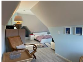
...das Dachzimmer, herrlich gemütlich: