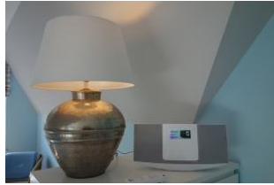
...und eine Musikanlage.