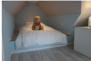
...die wir auf Wunsch auch zum Bett umfunktionieren können.