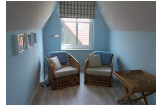
Bequeme Sessel laden als Rückzugsort ein. Auch hier gibt es ein TV-Gerät