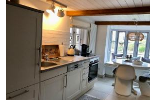
separate Küche mit Esstisch