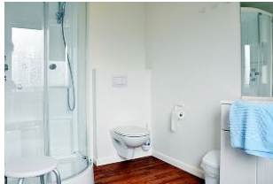
... und noch einen Blick ins Badezimmer.