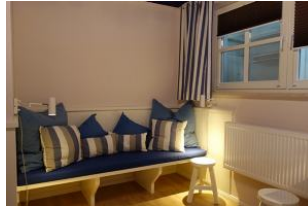
...herrlicher "Chillbank" !