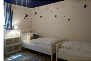
Das Schlafzimmer in der U 20 Zone mit 2 Einzelbetten 90x200cm, Sternenhimmel.....