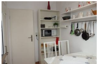
...alles in greifbarer Nähe.