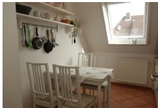
Der Essplatz in der Küche....