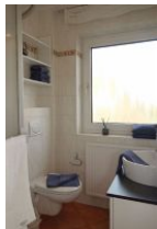
Das Bad mit großem Fenster...