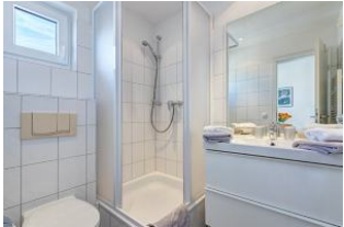
Duschbad mit kleinem Fenster