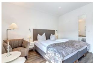
Sehr komfortables Doppelbett