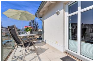
Dachterrasse nach Süden mit Essplatz