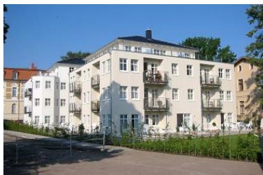
Hausansicht "Villa Aquamarina" von der Promenade