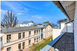
Dachterrasse (Blick seitlich)