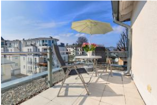
Dachterrasse nach Süden mit Essplatz