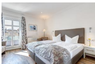
Schlafbereich und Sitzgelegenheit, Zugang zur Dachterrasse

1. Reihe an der Strandpromenade mit DACHTERRASSE und FAHRSTUHL im Haus! Chices 1-Zimmer-Apartment mit moderner guter Ausstattung. Kombiniertes Wohn-/Schlafraum, separate Küche mit Essplatz, Duschbad, Dachterrasse nach Süden mit Sonne bis abends. Die Wohnung verfügt über einen Pkw-Stellplatz. In der Garage können auch Fahrräder und ähnliches untergestellt werden. In unserer "Villa Germania" nebenan gibt es eine Sauna. Von der "Villa Aquamarina" sind es zum Ortszentrum und der Seebrücke ca. 3 Minuten zu Fuß. Zum Strand sind es 50 m.