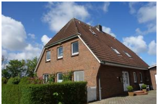
Die Ferienwohnungen Ebbe und Flut befinden sich im 1.OG

Unser Gezeitenhus bietet zwei Wohnung für 2-4 Personen. Die Wohnung 2 - Flut ist etwas größer als die "Ebbe" verfügt über 2 Schlafzimmer, eines mit großem Doppelbett, eines mit Doppelschlafcouch, Küche, Bad und natürlich einem gemütlichen Wohnzimmer. Auch in dieser Wohnung finden Sie nordische, klare Linien in der Einrichtung, die an Sommer, Sand und Meer erinnern. Treten Sie ein und genießen Sie Föhr! Im Garten befindet sich ein möblierter Terrassenplatz, der von den Mietern beider Wohnungen zu nutzen ist..