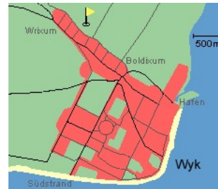
Entfernungen, zirka: zum Bäcker 100 m, zur Einkaufsmöglichkeit 3,0 km, zum Flugplatz 4,0 km, zum Golfplatz 4,2 km, zum Hafen 3,5 km, zum Meer 3,5 km, zum ÖPNV 100 m, zum Badestrand 3,5 km, zum Ortszentrum 100 m