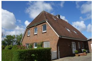
Die Ferienwohnungen Ebbe und Flut befinden sich im 1.OG

Unser Gezeitenhus bietet zwei Wohnung für 2-4 Personen. Die Wohnung 2 - Flut ist etwas größer als die "Ebbe" verfügt über 2 Schlafzimmer, eines mit großem Doppelbett, eines mit Doppelschlafcouch, Küche, Bad und natürlich einem gemütlichen Wohnzimmer. Auch in dieser Wohnung finden Sie nordische, klare Linien in der Einrichtung, die an Sommer, Sand und Meer erinnern. Treten Sie ein und genießen Sie Föhr! Im Garten befindet sich ein möblierter Terrassenplatz, der von den Mietern beider Wohnungen zu nutzen ist..