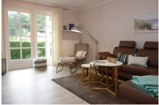
Das Wohnzimmer mit gemütlichem Leseplatz, großer Eckcouch....