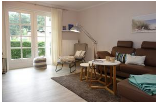
Das Wohnzimmer mit gemütlichem Leseplatz, großer Eckcouch....