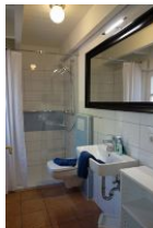
Das Duschbad im Erdgeschoß