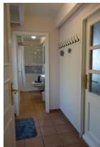
Der kleine Flur führt ins Bad. Rechts die Tür in die Garage, links die Tür auf die Terrasse