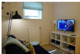
...TV Gerät und DVD Player