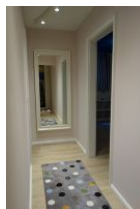
Der Flur führt rechts ins Schlafzimmer, links ins Spielzimmer