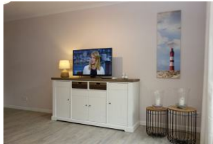
...TV Gerät und DVD Player ....