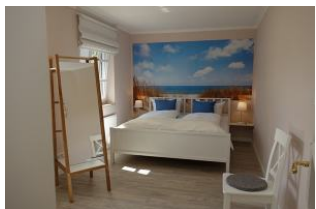
Das Elternschlafzimmer mit Nordseefeeing ....