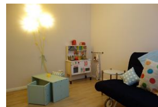
...und für unsere kleinen Gäste ein Tisch mit Stühlen und eine Spielküche