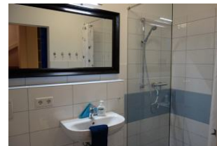
... ein Duschbad mit großer, bodengleicher Duschkabine, Handwaschbecken und Toilette