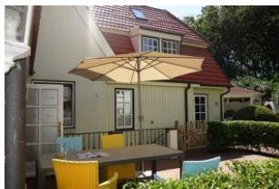
Die Terrasse mit großem Tisch und herrlich bequemen Sesseln.