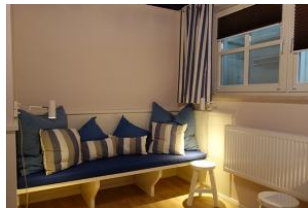
...herrlicher "Chillbank" !