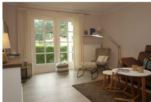
...hier noch einmal das Wohnzimmer..