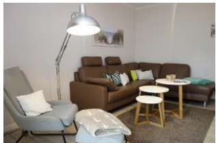
... hier noch einmal die Couch !