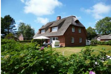
Gemütliches Endreihenhaus unter Reet in Nieblum, Bi de Süd 17.

Die Unterkunft verteilt sich über EG und 1.OG.