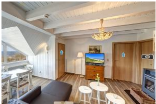
Wohnraum mit Seeblick

Direkt an der Strandpromenade mit phantastischem SEEBLICK und großem SÜDBALKON - das Besondere! Die außergewöhnliche 4-Zimmer-Wohnung mit zusätzlicher Empore nimmt das gesamte 2. Ober- und Dachgeschoss ein (ca. 96 qm). Drei separate Schlafzimmer (2 davon ohne volle Raumhöhe, gut geeignet für Kinder, Bad mit 2- Pers.-Whirlpool-Wanne und großer Dusche, zus. Gäste-WC, Küche, großes Wohnzimmer mit Kaminofen und verglaster Loggia mit Eßplatz und Seeblick sowie ein großer Balkon nach Süden mit Sonne bis abends machen die Wohnung zum Highlight! Das Mobiliar im Wohnzimmer ist teilweise antik, die Wohnung dennoch insgesamt modern und hell. Die Wohnung verfügt über einen Pkw-Stellplatz. Ein Strandkorb am Strand ist incl., eine Garage für Fahrräder und ähnliches (für das gesamte Haus) vorhanden. Im Haus gibt es eine Sauna. es sind vom Haus 50 m zum Strand, ca. 3 Min. zu Fuß ins Zentrum! (Tourismusverb.)