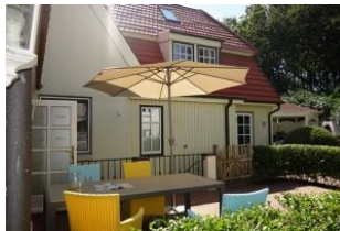
Die Terrasse mit großem Tisch und herrlich bequemen Sesseln.