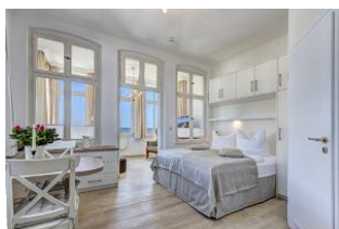
Blick in die Wohnung mit Seeblick

Direkt an der Strandpromenade mit herrlichem SEEBLICK aus der Veranda! Schönes 2 - Zimmer - Apartment mit gemütlicher und guter Ausstattung. Kombiraum mit Doppelbett, Küchenzeile mit Essplatz, Duschbad und Veranda als Wohnraum mit direktem Seeblick. Die Wohnung verfügt über einen Pkw-Stellplatz. In der Garage können Fahrräder und ähnliches untergestellt werden. Im Haus gibt es eine Sauna. Von der "Villa Germania" aus können Sie das Ortszentrum und die bekannte Ahlbecker Seebrücke in ca. 3 Minuten zu Fuß erreichen. Zum Strand sind es 50 m. Von Mai bis September ist ein Strandkorb im Tagespreis enthalten.