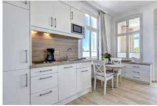
Küchenzeile und Essplatz