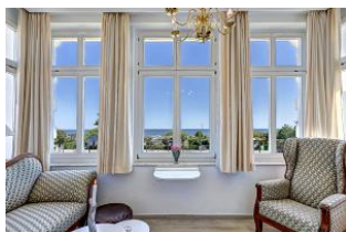
Veranda mit Seeblick