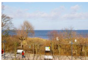
Seeblick aus der Veranda