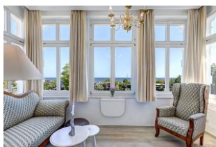
Blick in die Veranda