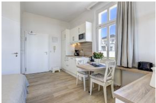
Blick auf Essplatz und Küchenzeile