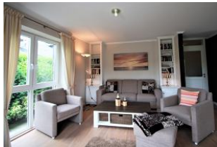
Von hier aus gelangen Sie direkt auf die Terrasse und in den kleinen Garten