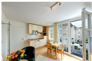
Küche mit Esszimmer

Direkt an der Strandpromenade mit SÜDBALKON und FAHRSTUHL im Haus! Schönes geräumiges 2-Zimmer-Apartment mit geschmackvoller guter Ausstattung. Separates Schlafzimmer (mit Fernseher), Wohnzimmer mit Küchenzeile und Essplatz, Duschbad, Balkon nach Süden mit Sonne bis abends. Die Wohnung verfügt über einen Tiefgaragen-Pkw-Stellplatz. In der Garage können auch Fahrräder und ähnliches untergestellt werden. In unserer "Villa Germania" nebenan gibt es eine Sauna. Von der "Villa Aquamarina" aus können Sie das Ortszentrum und die bekannte Ahlbecker Seebrücke in ca. 3 Minuten zu Fuß erreichen. Zum Strand sind es 50 m.