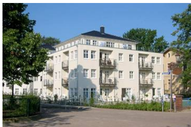
Hausansicht "Villa Aquamarina" von der Promenade