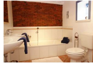
...Badewanne und Toilette ....