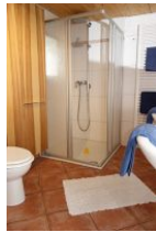
...und großer Duschkabine.