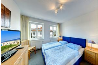
Schlafzimmer mit Fernseher