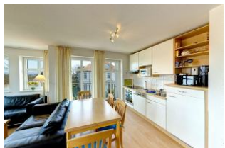
Küche mit Essbereich