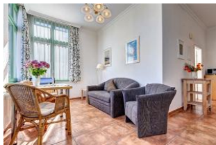
Essen und Wohnen