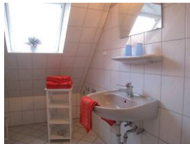
Das Badezimmer mit ...