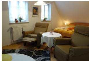
...beim Zurücklehnen kommt das Fussteil hoch - Entspannung pur.....