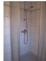
... Duschkabine; nicht im Bild: das WC