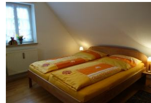
Ein großes Doppelbett für die Nachtruhe.