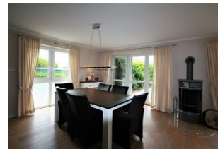
Der große Essbereich für gemeinsame Stunden