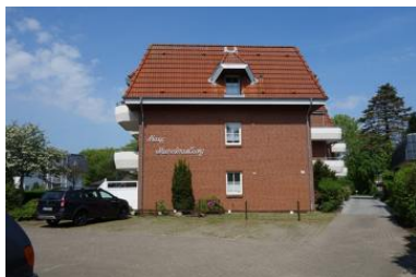
Die Aussenansicht des Hauses Meeresbrandung Gmelinstr. 12 in Wyk