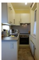
Die neue Küche mit Geschirrspüler, Backofen und Mikrowelle