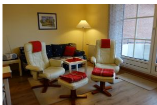
Das neue Wohnzimmer mit Laminatboden.

Sie suchen Entspannung ? Relaxsessel heißt das Zauberwort. Diese bieten wir Ihnen in einer gepflegten Zwei - Zimmer - Wohnung unweit vom Wyker Südstrand an. Die kleine Küche und das Wohnzimmer mit Austritt auf den Balkon sind komfortabel ausgestattet. Das Duschbad verfügt über eine hohe Duschwanne. Das Schlafzimmer mit großem Doppelbett ist gemütlich eingerichtet.