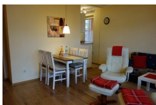
Der Essplatz, im Hintergrund die Küche.