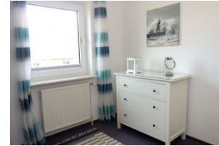
Kommode für Kleidung, Spielsachen etc.