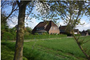
Das Haus Hardesweg 9