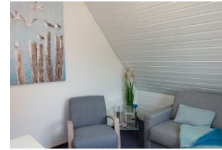
...und gemütlichem Sessel für ein Lesestündchen ?