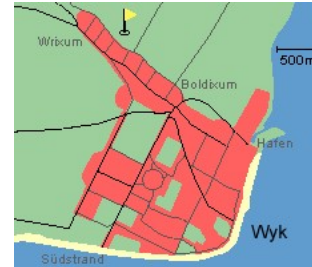
Entfernungen, zirka: zum Bäcker 100 m, zur Einkaufsmöglichkeit 3,0 km, zum Flugplatz 4,0 km, zum Golfplatz 4,2 km, zum Hafen 3,5 km, zum Meer 3,5 km, zum ÖPNV 100 m, zum Badestrand 3,5 km, zum Ortszentrum 100 m