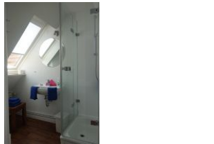
...und Handwaschbecken, nicht im Bild, die Toilette