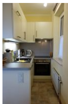
Die neue Küche mit Geschirrspüler, Backofen und Mikrowelle