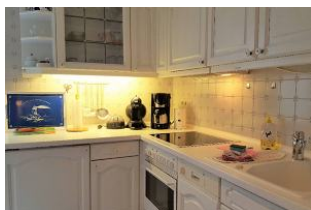
In dieser Küche macht das Kochen Spaß. Die Terrasse ist von hier direkt begehbar.