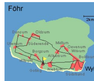
Entfernungen, zirka: zum Badestrand 400 m