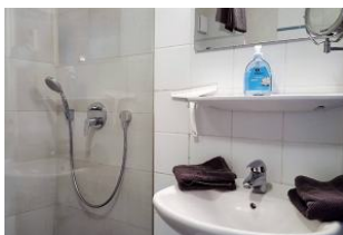
Neues ebenerdige Dusche