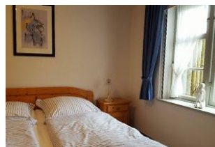
Im gemütlichen Schlafzimmer kann man seinem Traum freien Lauf lassen