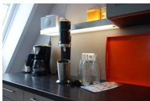
....kein-Flaschen-schleppen mehr ! Ein Soda Stream mit Echtglas-Flaschen.....