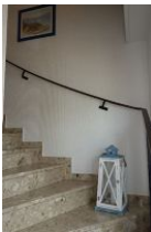
Das Treppenhaus führt zu beiden Wohnungen