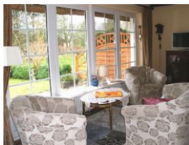
Wohnbereich mit Zugang zum schönen grossen Garten mit Teich

Nieblum ? zweitgrößter Ort und wohl das schönste Dorf auf Föhr und eines der schönsten Dörfer in Schleswig-Holstein, mit schmucken Friesenhäusern, mächtiger Kirche und einem ruhigen Strand. Nur ca. 10 Minuten zum Strand und 5 Minuten vom Ortskern entfernt liegt dieses schöne Reihenhäuser mit eigenem grossen Garten und kleinem umzäunter Teich und schöner Terrasse viel Platz bietet Ihnen dieses Haus drinnen und auch draussen. Räumlichkeiten: Erdgeschoss: separate Küche, Wohnzimmer mit Kamin, Gäste WC, Obergeschoss: 2 Schlafzimmer neu renoviert mit Laminat, Badezimmer mit Badewanne Komfort: Geschirrspüler, Mikrowelle, Kamin, Essplatz im Wohnzimmer, Badewanne, 1 Doppelbett, 2 Einzelbetten, grosser eigener Garten mit Teich, Gartenmöbel, Fernseher, Waschmaschine