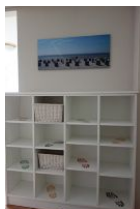
Der Eingangsbereich mit viel Platz für Schuhe