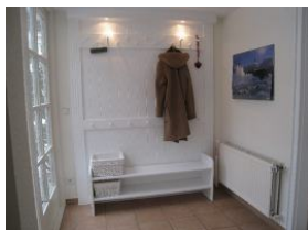
Der Eingangsbereich mit großer Garderobe

Idyllischer kann man mitten in der Stadt kaum wohnen. Das Haus Johanna liegt in der Feldstrasse in zweiter Reihe. Zum Strand sind es nur 3 Gehminuten, zum Bäcker ebenfalls. Herrlich, auf der Terrasse sitzen und es sich gut gehen lassen - hören werden Sie außer dem eigenen Familiengeplapper nur das Geklapper der auf Föhr lebenden Störche von nebenan. Idylle in der Stadt .....! Vier Schlafräume, drei Bäder und gemeinschaftliche Räume lassen auch der Großfamilien oder befreundeten Familien genügend Raum zur Erholung. Neuigkeiten: nebenan, im gleichen Haus gibt es jetzt noch eine Wohnung für 4-5 Personen - unsere Johanna 2