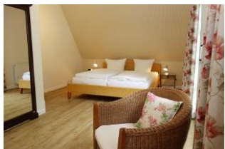
Das große Elternschlafzimmer im OG, nicht im Bild: TV Gerät