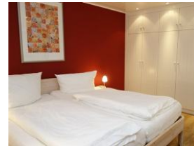
Ein weiteres Schlafzimmer (UG) mit großem Doppelbett und Einbauschränk