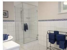
Das Duschbad im UG, daneben noch ein Abstellraum und die Waschmaschine.