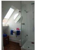
...und Handwaschbecken, nicht im Bild, die Toilette