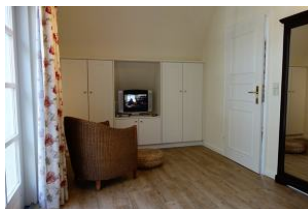
Ein Plätzchen zum "zurück ziehen" im Schlafzimmer