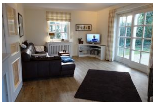
Das Wohnzimmer im nordischen Stil mit herrlich großer Sitzecke.