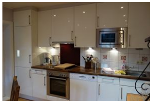
Die offene Küchenzeile mit Ceranfeld, Backofen, Geschirrspüler, Kühlschrank.