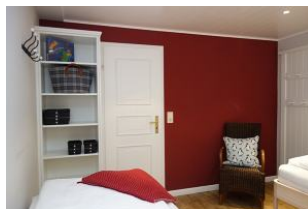
Ein offener Schrank und Garderobenpaneel