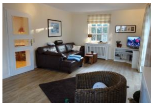
..die Tür führt in die Küche.