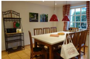
Herrlich - eine sep. Küche....