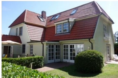
Die Aussenansicht des Hauses Johanna in der Feldstrasse.

Die Unterkunft verteilt sich über EG, UG und 1.OG.