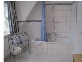
Badewanne, Duschmöglichkeit vorhanden.