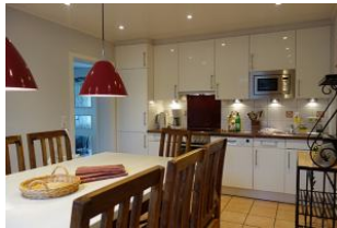
....an diesen Tisch passt die ganze Familie !