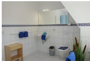
Das große Badezimmer im OG mit....