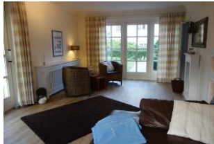
Eine kleine Sitzzecke mit zwei Sesseln....