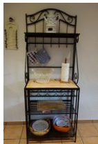
Modernes Sideboard ..