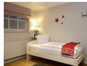
...das zweite Bett.