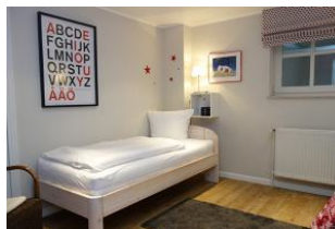
Ein Schlafzimmer mit 2 Einzelbetten, je 90x200cm