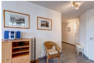
Blick in den Eingangsflur