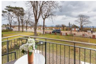
Balkon im Winter