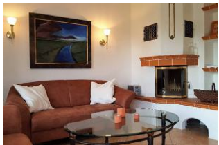
Kamin im Wohnzimmer

Nieblum, zweitgrößter Ort und wohl das schönste Dorf auf Föhr und eines der schönsten Dörfer in Schleswig-Holstein, mit schmucken Friesenhäusern, mächtiger Kirche und einem ruhigen Strand. Nur ca. 10 Minuten zum Strand und 5 Minuten vom Ortskern entfernt liegt dieses schöne Reihenhäuser mit grossem Garten, einer schönen Terrasse in Südlage. Viel Platz bietet Ihnen dieses Haus drinnen und auch draussen. Räumlichkeiten: Erdgeschoss: sep. Küche, Wohnzimmer mit Kamin, Gäste WC, Obergeschoss: 2 Schlafzimmer, Badezimmer mit Dusche Komfort : Geschirrspüler, Mikrowelle, Kamin, Essplatz im Wohnzimmer, Doppelbett, King Size Bett, grosser Garten mit Gartenmöbel, Strandkorb, 2 Fernseher, Waschmaschine, Trockner Untergeschoss: 2. Duschbad Ruhebereich im Dachgeschoss mit TV