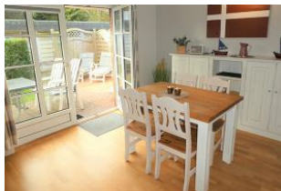
Hier befindet sich der direkte Ausgang auf die eigene Terrasse.