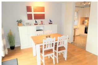
Der helle Essbereich bietet Platz für bis zu 4 Personen.

Das Lüttje Fischerhuus liegt in einer kleinen, ruhigen Nebenstraße von Wyk. In der Nähe finden sie alle Geschäfte des täglichen Bedarfs und sind nur wenige Minuten vom Wyker Südstrand entfernt. Diese helle und freundliche Doppelhaushälfte bietet Platz für bis zu 4 Personen und verteilt sich auf 2 Etagen. Im EG befindet sich das gemütliche Wohnzimmer mit schönem Essbereich und dem direkten Ausgang auf die eigene Terrasse. Die separate und gut ausgestattete Küche lässt keine Wünsche offen. Auch ein Gäste-WC ist im EG zu finden. Im 1 OG befinden sich zwei Schlafzimmer mit jeweils einem Doppelbett (180x200 und 140x200). Auch ein modernes Duschbad liegt in dieser Etage. Sie werden sich hier mit ihrer Familie wohlfühlen und gut erholen.