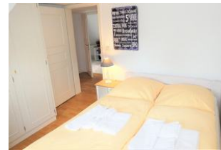
Das zweite Schlafzimmer mit kleinem Doppelbett (140 x 200)